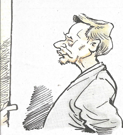
Karikatur: Jürgen Tomicek